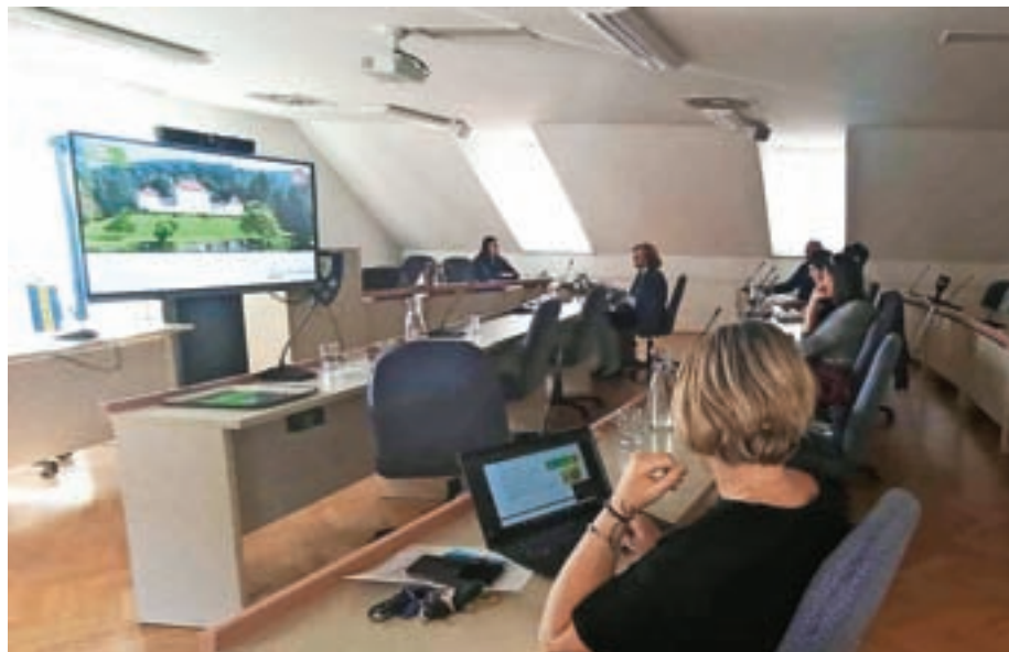
Trajnostni turizem je danes edina možna razvojna pot, smo slišali udeleženci na izobraževanju.

Izvajalec izobraževanja je bil Zavod Tovarna trajnostnega turizma – GoodPlace, ki združuje 12 soustanoviteljev iz Slovenije in tujine, ki delujejo tako na področju turizma kot tudi na drugih, širših komplementarnih področjih. Razvijajo znanja in orodja, povezana