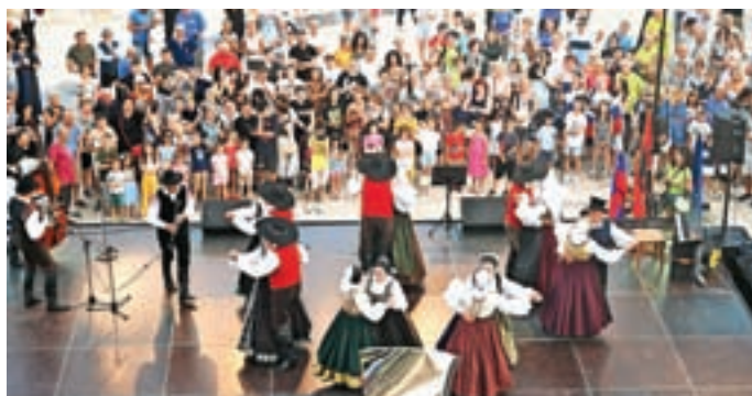
Med nastopom

jali. V Albaniji smo preživeli štiri čudovite dneve na plaži, ob bazenu in ogledu znamenitosti Tirane in Drača. V ponedeljek pa smo takoj po zajtrku pohiteli na avtobus proti domu. V Cerklje smo se vrnili v torek, 21. junija, ponoči. Poslovili smo se od svojih novih prijateljev in si obljubili, da se srečamo na eni od naših prireditev.