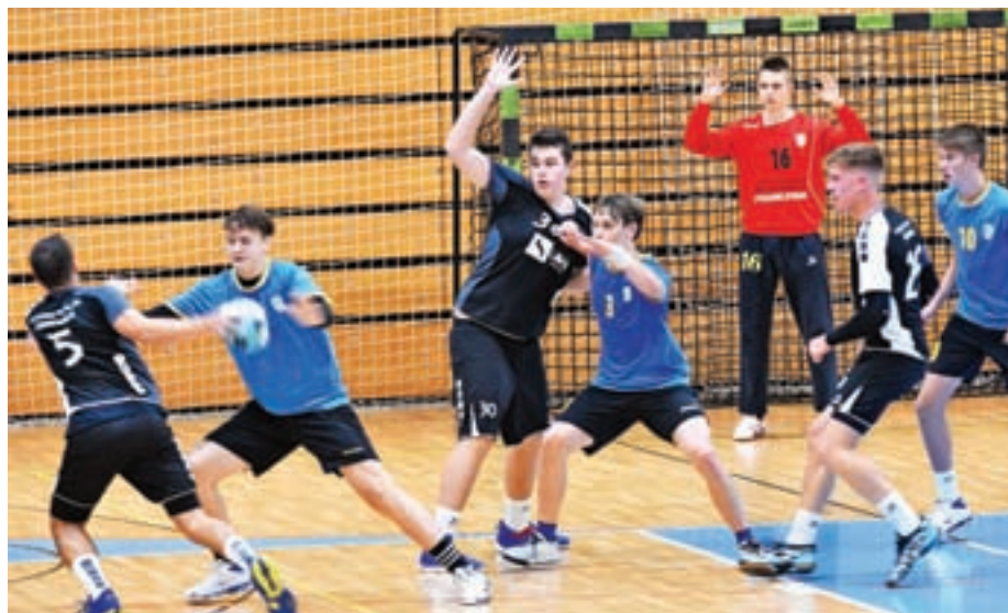
Utrinek s tekme mladincev RK Cerklje – RK Črnomelj

V klubu imamo v prihodnje nove, še višje cilje. Želimo postati športni kolektiv, ki bo v občini Cerklje na Gorenjskem predstavljal novosti v športu, sodobne prijeme, skratka deloval usmerjeno in razvojno ter ne nazadnje igral sodoben rokomet. Tak pristop bomo imeli tako pri stroki, predvsem pri delu z mladimi in najmlajšimi, kot pri organizacijskem vodenju kluba. Trudili se bomo, da bomo