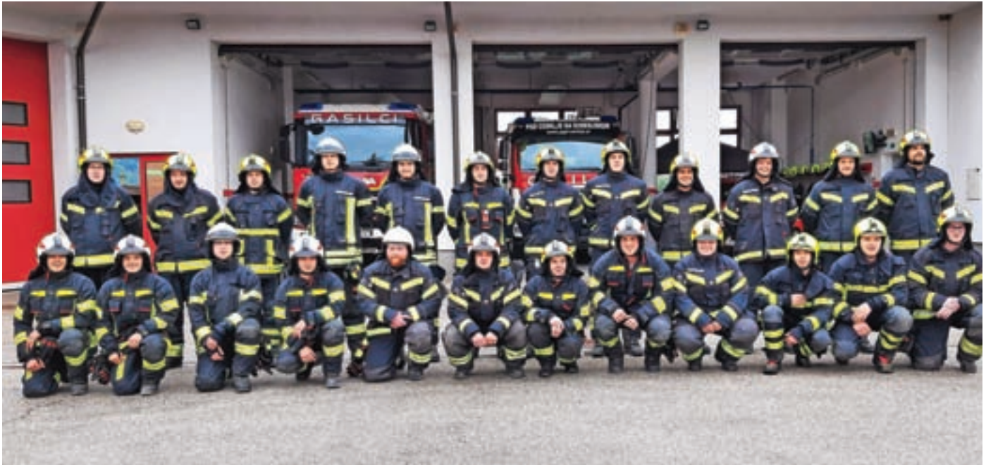
Devetindvajset pripravnikov se je udeležilo 149-urnega tečaja za operativnega gasilca.

Tečaj za operativnega gasilca, ki ga je organizirala Gasilska zveza Cerklje, je uspešno opravilo štiriindvajset pripravnikov.