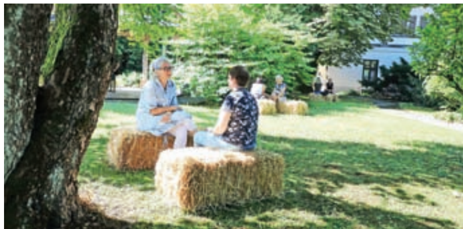
Živa knjižnica na vrtu Hribarjeve vile

Zadnjo soboto v juniju je na vrtu Hribarjeve vile potekala t. i. živa knjižnica, ki deluje kot vsaka druga, le da si obiskovalci-bralci izposojajo »žive knjige« – ljudi z zanimivimi življenjskimi zgodbami, s katerimi se lahko pogovorijo na štiri oči. »Zavod za turizem Cerklje si prostore v Petrovčevi hiši deli z izpostavo kranjske mestne knjižnice, in tako sva s knjižničarko prišli na idejo, da bi z živo knjižnico, ki jo sicer poznamo že iz nekaterih drugih krajev po Sloveniji in tudi na Gorenjskem, organizirali dogodek, s katerim bi tudi v lokalnem okolju pomagali razbijati predsodke,« je povedala Nataša Ovsenek s cerkljanskega zavoda za turizem. Živo knjižnico je