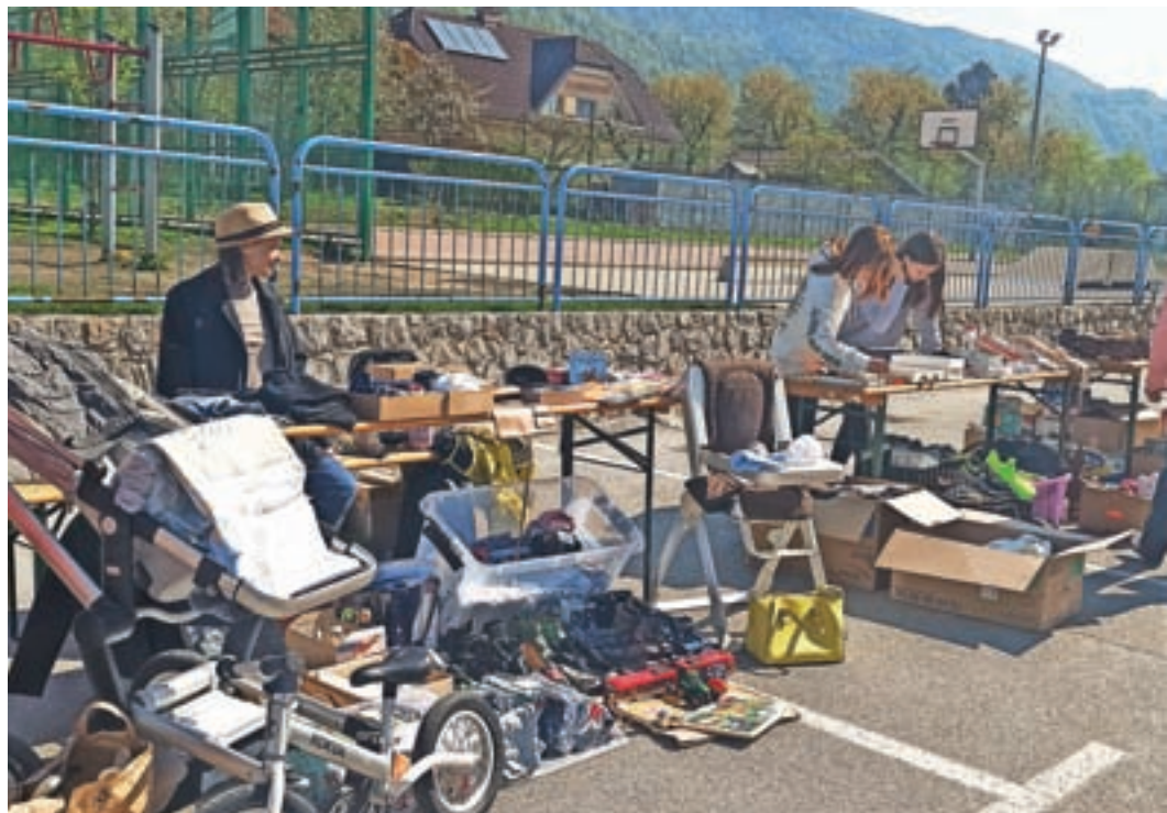
Sejem rabljenih stvari je ponudil pestro izbiro najrazličnejših izdelkov.

Tako se je na lepo, sončno sobotno dopoldne zbralo nekaj domačinov, ki so menjali, prodajali ali podarjali svoje rabljene, a ohranjene stvari. Med izdelki smo zasledili otroško opremo, oblačila, obutev in gospodinjske pripomočke, knjige ter igrače. Veseli smo, da tudi pri nas lahko spodbujamo lokalno prebivalstvo in ga na ta način ozaveščamo. Prepričani smo, da se s takšnimi spodbudami in akcijami krepi zavest o trajnostno naravnem razmišljanju.