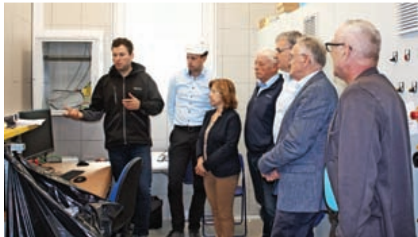
Predstavniki občin so si ogledali delovanje ultrafiltracijskega sistema.

Občina o aktualnem dogajanju na projektu poroča tudi na spletni strani https://cerklje.si/objava/481661 .