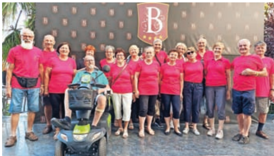
Folklorniki v Albaniji

V sredo, 15. junija, zvečer smo odpeljali na dolgo pot z avtobusom v Albanijo – na Festival Slovenija v Draču 2022. Naši sopotniki v avtobusu so bili pevci ljudskih pesmi Kranjski furmani, Sorški orgličarji iz Sore in člani folklorne skupine Grifon iz Šempetra pri Celju. Šele jutro nas je malo zbistrilo, da smo lahko občudovali lepote hrvaške, bosanske in črnogorske obale. Med potjo smo se potniki med seboj bolje spoznavali in navezali prijateljske stike. Namestili smo se v hotelu Bonita na hotelski avenijski pred Dračem. Prvi večer smo imeli Spoznavni večer na terasi hotela, kjer smo prejeli festivalske table, ki smo jih potrebovali na povorki in na nastopih. Izmenjali smo si darila. Pozdravila sta nas namestnica slovenskega veleposlanika v Albaniji prof. dr. Petra Japlja in predsednik festivala Zoran Strežovski ter direktor festivalov Si.in Aleš Breznikar. Večer smo nadaljevali s plesom in zabavo. Naša folklorna skupina je nastopila že na prvem festivalskem