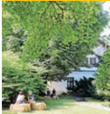
Poletno dogajanje na vrtu Hribarjeve vile