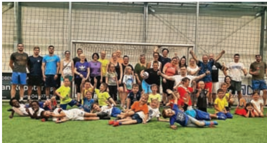
Zaključka sezone so se udeležili tudi starši starostne skupine U8.

Igrišča v Velesovem pa ne bodo dolgo mirovala. Že v juliju nekatere selekcije začnejo treninge in priprave na sezono, ki se bo s prvimi tekmami začela