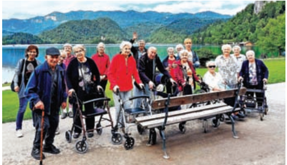
Stanovalci doma na Bledu