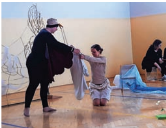
Vzgojiteljice so pripravile tudi dramske igrice za otroke.

V pomladanskem času smo vzgojiteljice pripravile še tretjo predstavo, in sicer pravljico Frana Levstika Kdo je napravil Vidku srajčico. Zadnja predstava je bila bogato glasbeno obar-